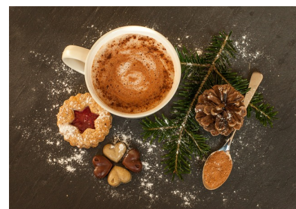
Bils: heiße Schokolade

Nun toppen Sie die heiße Schokolade noch mit Cashew-Vanille-Creme servieren das Getränk zum Schluss Ihren Gästen.